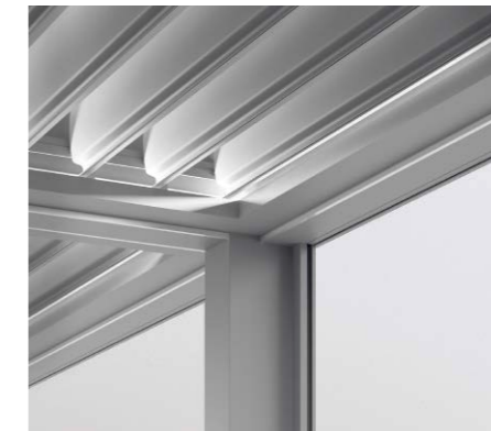
LED-Beleuchtung indirekt: 90 Grad nach oben gerichtet zu den Lamellen.