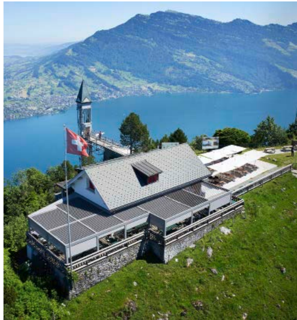
Blick auf das Ausflugsrestaurant Hammetschwand mit dem neuen Lamellendach (vorn).

4.) Ein starkes Team mit 22 hochmotivierten Spezialisten